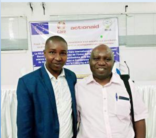
A part notre participation dans le Consortium, GLPI participe dans d' autres processus ou autres discussions organisées par d' autres organisations internationales

Le Représentant Légal du GLPI a été consulté par Quaker UN Office pour donner sa contribution.